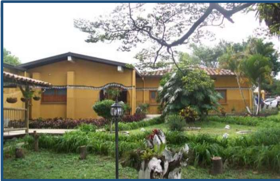
Centro Vida Hogar de los Recuerdos Zona Sur